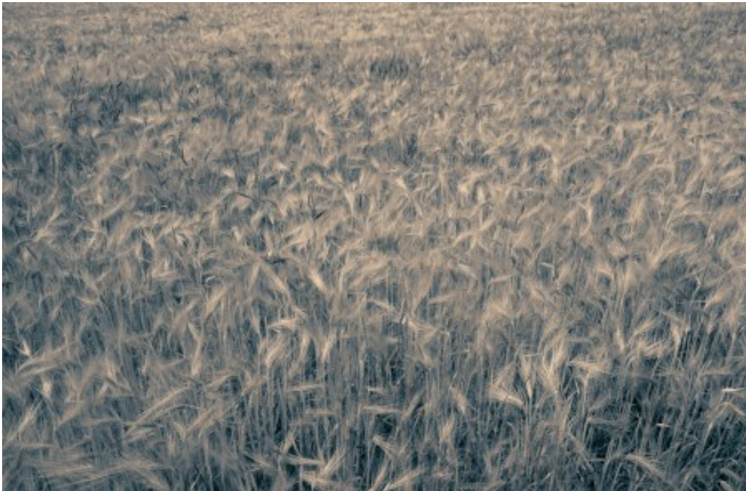
Abbildung: Auf dem Kornfeld.

Einen Tag später hat man so viel zusammengetragen, daß man mit dem Worfeln 3 beginnen will: Man begibt sich auf den zentralen Dorfplatz, wo man bereits einen etwa einen Klafter 4 durchmessenden Lehmziegelkreis gemauert hat; er ist kaum eine Handbreit hoch. Eine Gruppe von Frauen wirft die abgeschnittenen Ähren inmitten des Kreises; eine andere Gruppe drischt mit Flegeln darauf ein, bis die Körner fliegen; eine dritte Gruppe fegt die Spreu zusammen und wirft sie in leichten, flachen Korntellern in die Luft, daß der Wind das Unnütze ausblase, das gute Korn aber erhalte.