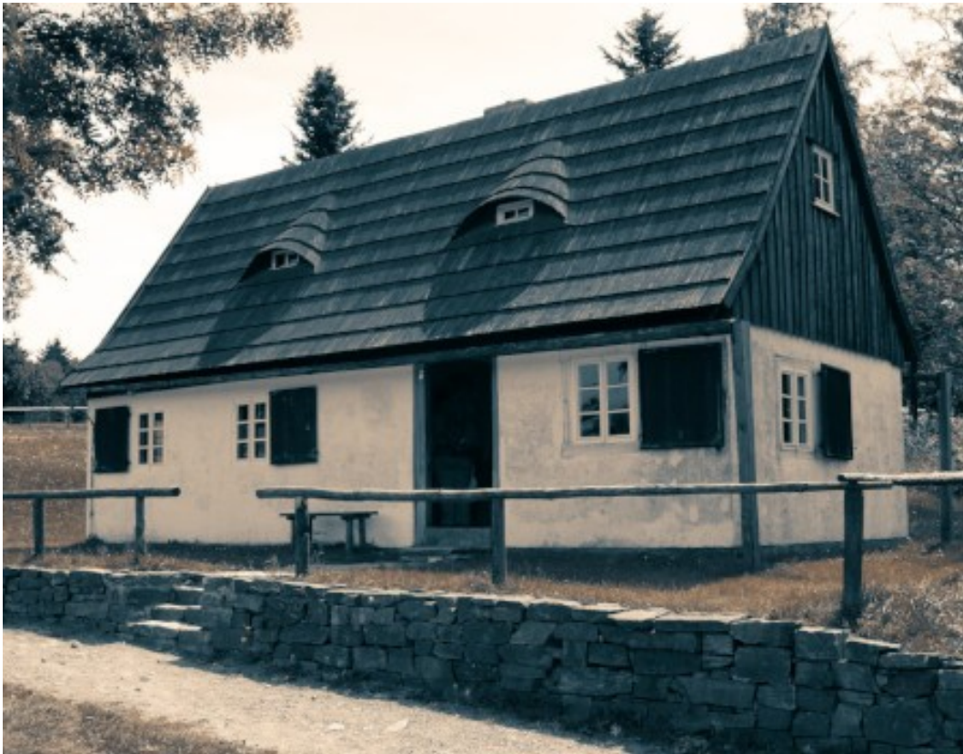
Abbildung: Die Hütte des Seilers.

Das Zimmer ist mit Kerzen ausgeleuchtet, obwohl durch das Fenster genug Licht eintritt. Der Raum ist zweigeteilt, auf der linken Seite wartet bereits ein Mann auf sie.